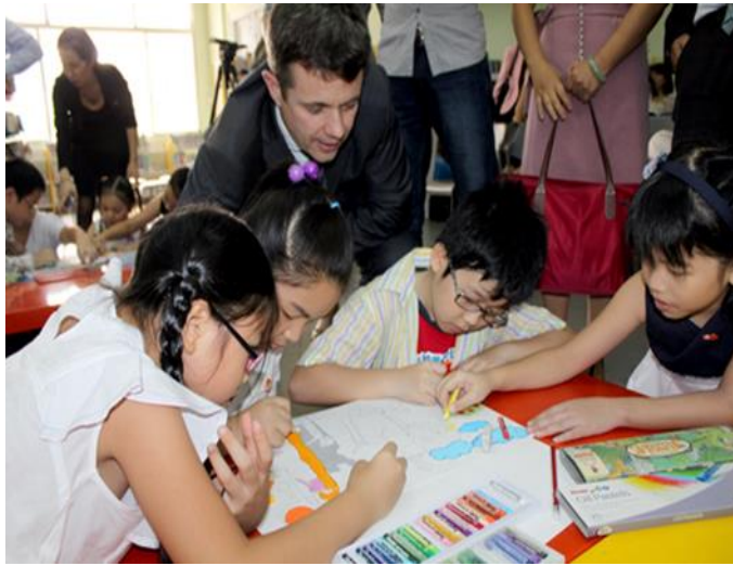
Kỹ năng xử lý