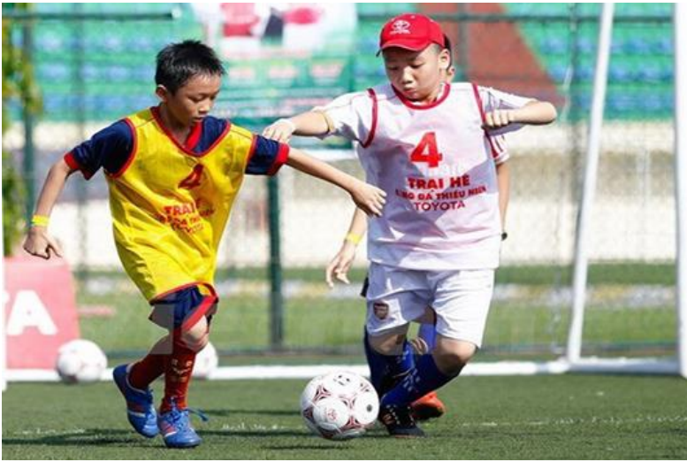
Kỹ năng vận động