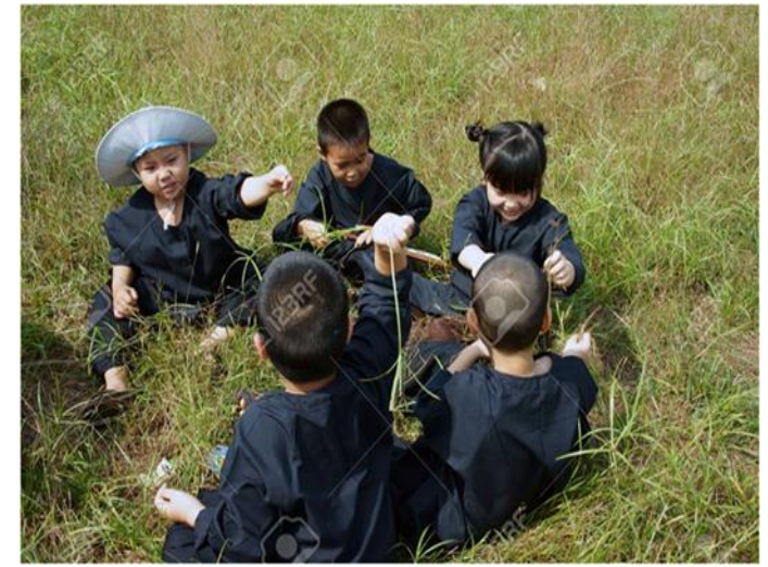
Kỹ năng tương tác xã hội